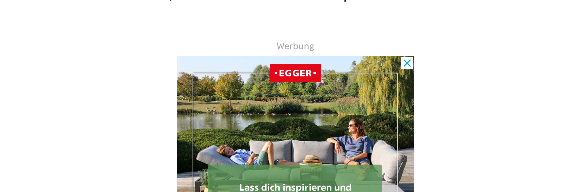
Lass dich inspirieren und persönlich beraten – für dein zweites Wohnzimmer in der Natur.

Problematisch ist aber nicht nur, dass die Jugendlichen ständig solchen Bildern ausgesetzt sind, sondern auch, woher diese Bilder stammen. «Auf Social Media sind es häufig gleichaltrige oder nur wenig ältere Influencer, die vorzeigen, wie viel besser ihr Leben nach der OP ist. Was nicht erwähnt wird: Viele dieser Stars werden von Kliniken bezahlt, über ihre Resultate zu sprechen.»